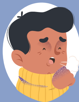
TOUX / GORGE je tousse et j'ai la gorge qui pique