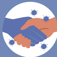
CONTACT quand une personne m'embrasse ou me sert la main