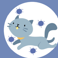
ANIMAUX par des animaux qui peuvent être aussi malade (chien, chat...)

Comment on se protège pour ne pas attraper cette maladie si une personne est déjà malade à la maison ou au travail ?