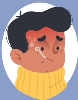
FIÈVRE j'ai chaud

Les symptômes de cette maladie (ce que je ressens) :