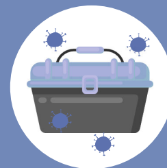
OBJETS par des objets touchés par une personne malade