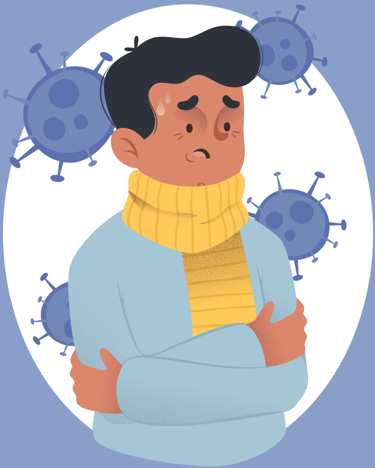
COVID-19 c'est le nom de cette maladie

Les symptômes de cette maladie (ce que je ressens) :