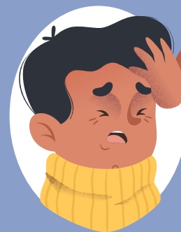
TÊTE j'ai mal à la tête