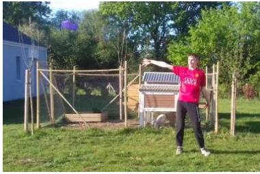
Une partie de fresbee