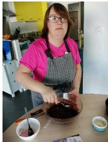
Réalisation, d'un délicieux gâteau au chocolat !